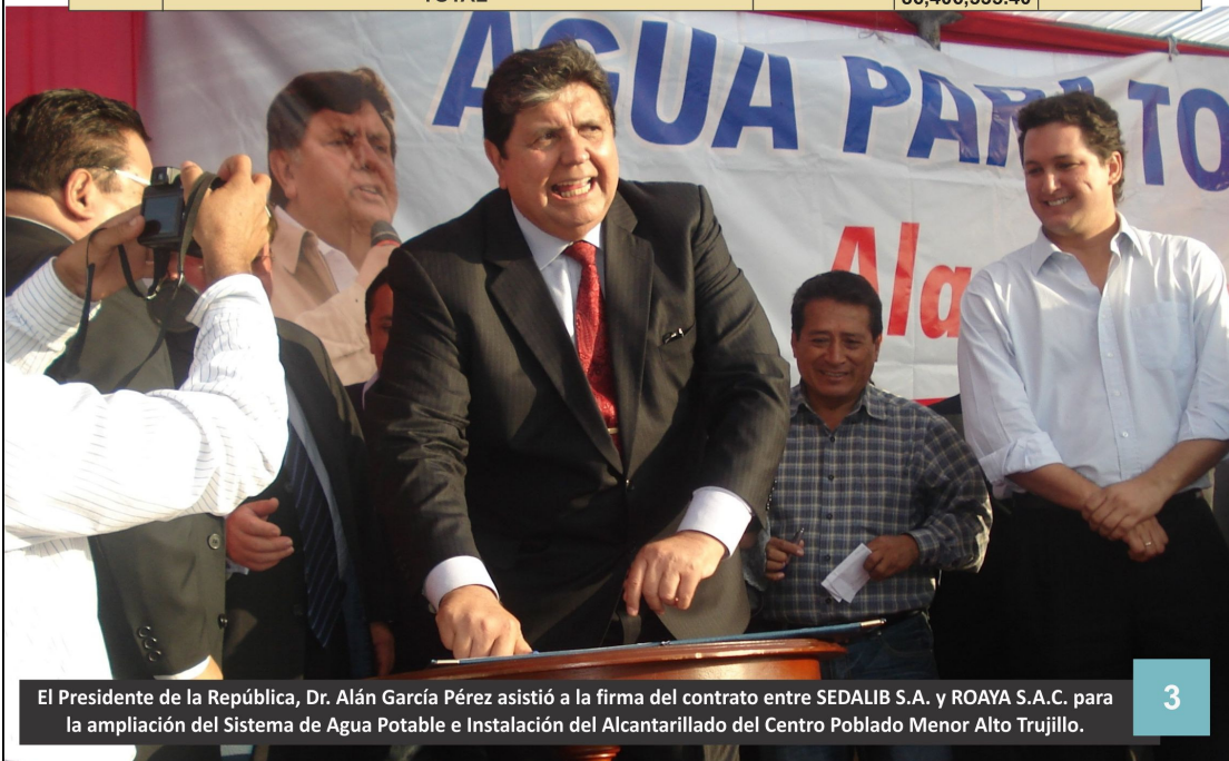
El Presidente de la República, Dr. Alán García Pérez asistió a la firma del contrato entre SEDALIB S.A. y ROAYA S.A.C. para la ampliación del Sistema de Agua Potable e Instalación del Alcantarillado del Centro Poblado Menor Alto Trujillo.